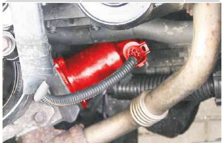
AGR-Ventil im Renault Master JD1M (hervorgehoben)